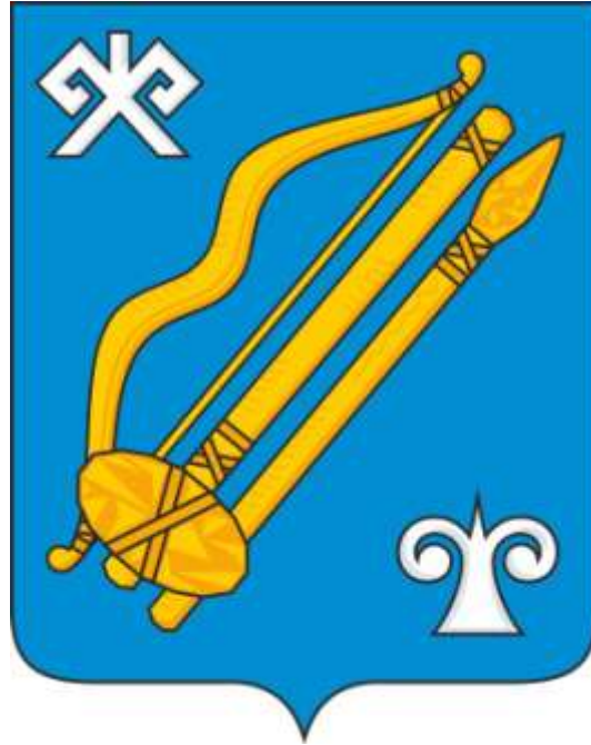
Герб муниципального образования «Город Горно-Алтайск» (воспроизведение в цвете)