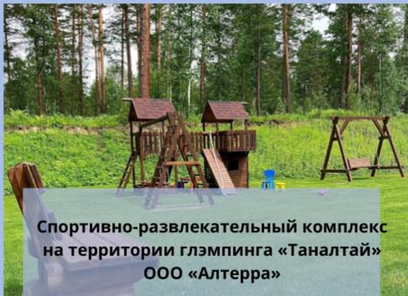
Спортивно-развлекательный комплекс на территории глэмпинга «Таналтай» ООО «Алтерра»